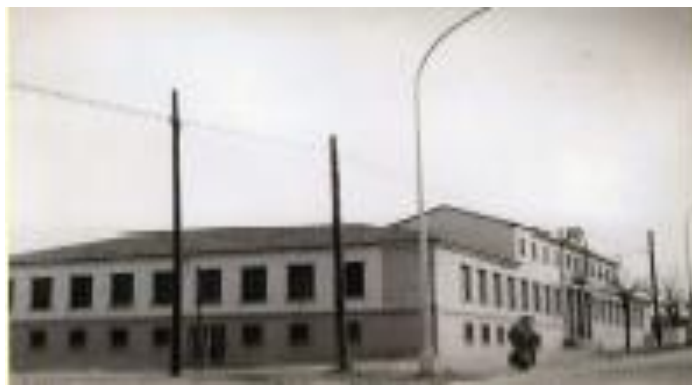
Exterior de nuestro centro hacia finales de los años 80.

Es la transición, en el más amplio sentido de la palabra. La muerte del dictador Franco, con la consiguiente desaparición de la Organización Sindical del antiguo régimen, y la Ley General de Educación de 1970 suponen una prueba de fuego y una situación crítica para el Centro.