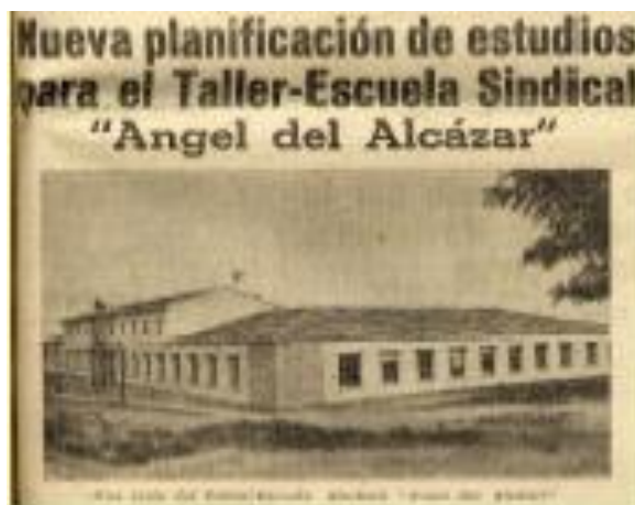
Noticia en la prensa de los años 50.

Sin embargo resulta curioso que no haya podido encontrarse ninguna referencia a la inauguración oficial del Centro, circunstancia ésta que, de confirmarse, sería toda una anécdota para la celebración del 50 aniversario.