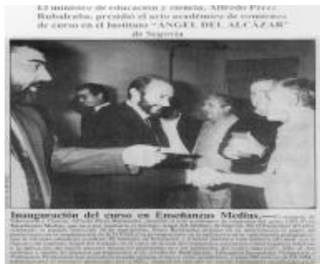
El entonces Ministro de Educación, Alfredo Pérez Rubalcaba, inaugura en curso académico en nuestro centro.

La L.O.G.S.E., pese a sus ensayos, retrasos y carencias de financiación, cubre el vacío legal existente entre la edad escolar (14 años) y la edad laboral (16 años). El Centro pone en práctica la primera reforma educativa desde mediados de los ochenta y se incorpora anticipadamente a la Reforma en 92-93, año en que el entonces Ministro de Educación, Alfredo Pérez Rubalcaba viene a inaugurar el curso académico.